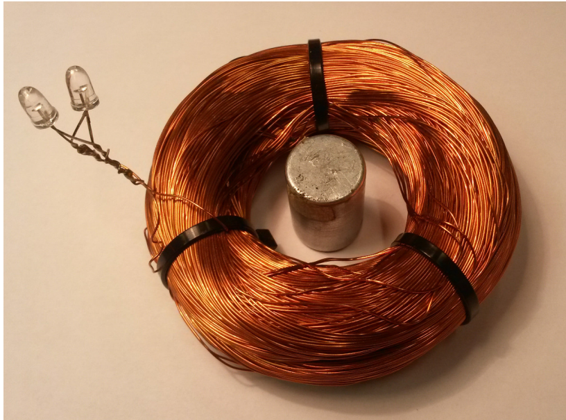
Figure B1: Kuvateksti, jossa on liitteen numerointi

Liitteissä voi myös olla kuvia, jotka eivät sovi leipätekstin joukkoon: Liitteiden