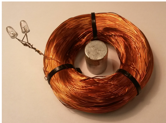
Kuva 1: Tämä on esimerkki kuvatekstistä.

Opinnäyte sisältää yleensä kuvia ja taulukoita, joissa on kuvatekstit. Kuvien kuvatekstit laitetaan yleensä kuvan alle, kuten kuvissa 1 ja 2, mutta taulukoissa taulukon yläpuolelle, kuten taulukossa 1. Huomaa, että taulukoiden otsikoihin ja kuvateksteihin käytetään lihavoitua pääteviivatonta eli groteskia eli sans serif -fonttia, tässä tapauksessa Helvetica-kloonina. Itse kuvatekstin selitteessä käytetään pääteviivallista eli antikvaa eli serif -fonttia. Näin lukija erottaa helposti selitteet ja leipätekstin toisistaan. Niin otsikoiden kuin kuvatekstin fonttikoko on 12 pt (katso liite B).