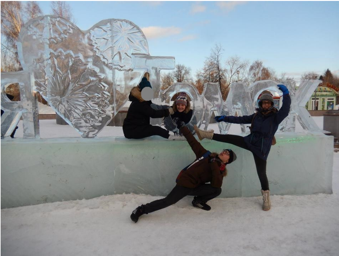
BBC:n järjestämässä kaupunkisuunnistustapahtumassa.

Tomskin Buddy Building Clubille, joka oli vastuussa kaikesta tutoroinnista ja vaihtaritoiminnan pyörittämisestä, täytyy vielä antaa erityismaininta. BBC järjesti vaihtareille usein muun muassa bileitä ja kaikenlaisia ekskursioita. Erityisesti opiskelijoiden vastaanotto hoidettiin Tomskissa ihan viimeisen päälle – kaikkia oltiin saapumispäivänä erikseen vastassa lento- ja juna-asemilla ja kaikilla oli oma tutor (tai tuttavallisemmin buddy), joka auttoi käytännön paperiasioiden kanssa kaupunkiin saapumisen jälkeen. Oma tutorini oli esimerkiksi tulkkina kun kävin hankkimassa venäläistä sim-korttia ja hän myös näytti minulle kaupunkia ensimmäiset päivät. Siperiaan lähtöä ei siis kannata pelätä tai kauhistella, sillä Tomsk on sellainen paikka, jossa kaikki vaihtarit otetaan avosylin vastaan.