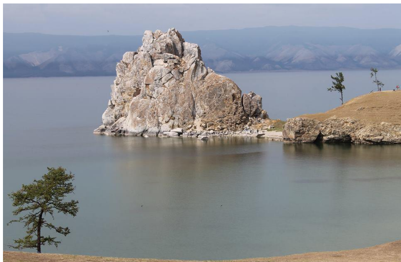
Näkymä Baikalin saaren rannalta.

Opiskelun lomassa sai matkustaa halutessaan melko vapaasti. Itse tosin lähdin ensimmäiselle pitemmälle reissulleni vasta kurssien päättymisen jälkeen kesäkuussa. Matkustaessani hämmästyin kerta toisensa jälkeen siitä, kuinka laaja ja monimuotoinen maa Venäjä on. Porukkaa on ihan joka lähtöön – uskonnot vaihtelevat ortodoksisuudesta buddhalaisuuteen, kielet venäjämästä lukuisiin vähemmistökieliin ja ihmisten kasvopiirteet eurooppalaisesta aasialaiseen. Siperiaa voisi siis luonnehtia varsin mielenkiintoiseksi matkakohteeksi, jossa riittää erilaista nähtävää.