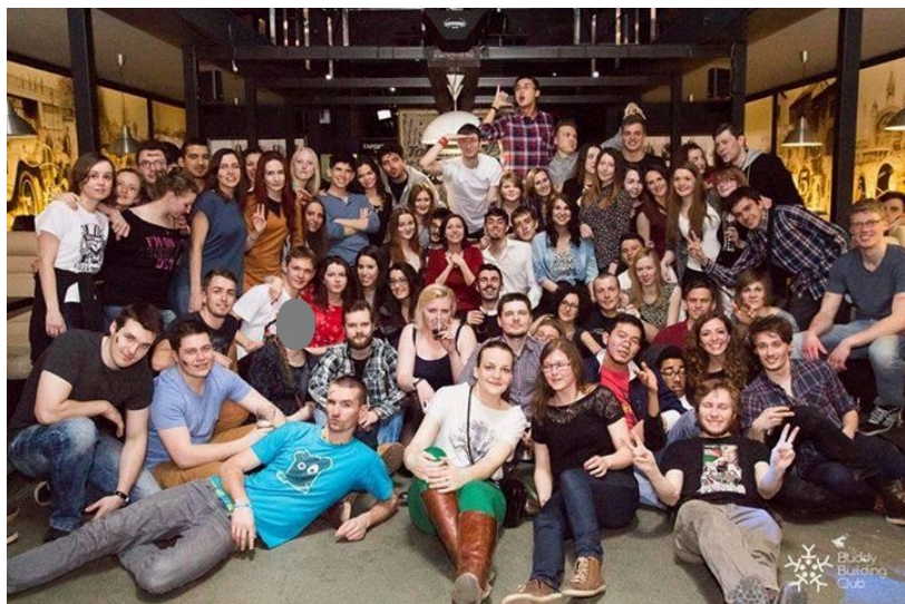
Vaihtariporukamme BBC:n järjestämissä bileissä.

Verrattuna moniin vähän hölmöihin ennakkoletuksiini siperialaisista kaupungeista, ("siellä on varmaan vaan tosi tyhjää ja karua") Tomskista löytyi yllättävän paljon kaikkea aktiviteettia. Kaupungin monet kahvilat ja baarit tarjosivat useita mahdollisuuksia yhdessä hengailuun. Ravintoloista sai perinteisen venäläisen ruoan lisäksi myös monenlaisia etnisiä vaihtoehtoja. Lisäksi kävimme vaihtariporukalla muun muassa luistelemassa ja